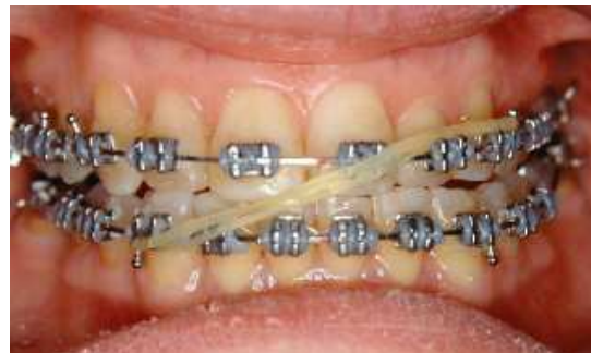
Elastico usato per perfezionare l'allineamento delle linee mediane dentali

viene ridotto, ma annullato !! (movimento di avanti e dietro).