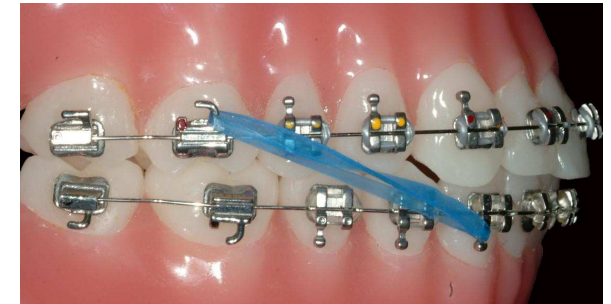
Elastico di III classe