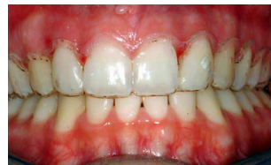
Contenzione trasparente superiore

Pulite la vostra contenzione almeno due volte al giorno usando uno spazzolino morbido, acqua fredda e sapone neutro per mani. Spazzolate tutte le superfici e sciacquate bene. E' opportuno disinfettarla 1-2 volte a settimana diluendo 5ml di Amuchina in 250ml di acqua fredda o usare New SterilSistem Chicco (prodotto predosato). Sciacquare sempre bene con acqua fredda. Non immergerla MAI in collutorio, candeggina o acqua calda.